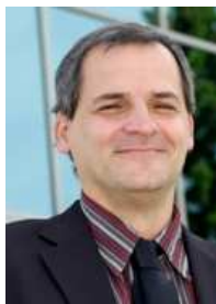
M. Alain Webster

Président de la Commission d'enquête sur la gestion de l'eau au Québec (1998-2000)